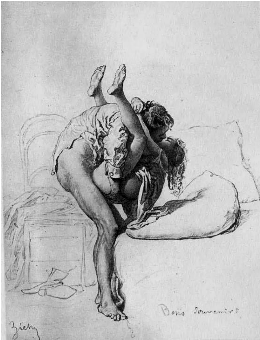
Εικόνα 5- «Νομίζω ότι είναι η μόνη ολοκληρωμένη σεξουαλική πράξη που έχω βάλει»(Α. 24 ετών, γυναίκα).

ετεροφυλοφιλικές σχέσεις, δεν ξέρω για τις ομοφυλικές, όταν πηγαίνουμε με μια κοπέλα να λέμε πηδήχτηκα με την τάδε ή πήδηξα την τάδε. Συνήθως είναι πήδηξα την τάδε, έχω γαμήσει τόσες, έχω γαμήσει τη Μαρία και ιδιαίτερα σε αντρικές παρέες ξεχνάμε ότι αυτό το γαμημένο πράγμα απαιτεί δύο άτομα τουλάχιστον οπότε πρέπει να νοιαζόμαστε...» (Χ. 28 ετών, άντρας).