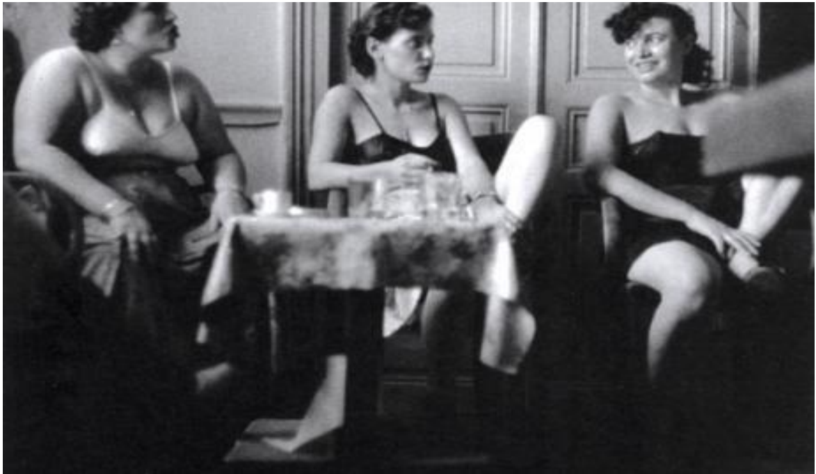
Κώστας Μπαλάφας Η Χώρα μου , Μουσείο Μπενάκη-Ποταμός, Αθήνα, 2008