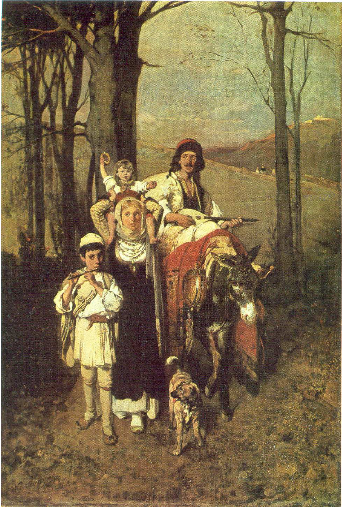
Εικόνα 2: Νικηφόρος Λύτρας, Επιστροφή από το πανηγύρι της Πεντέλης , λάδι σε μουσαμά, 1,00 x 0,66 μ. (Συλλογή Κουτλίδη).