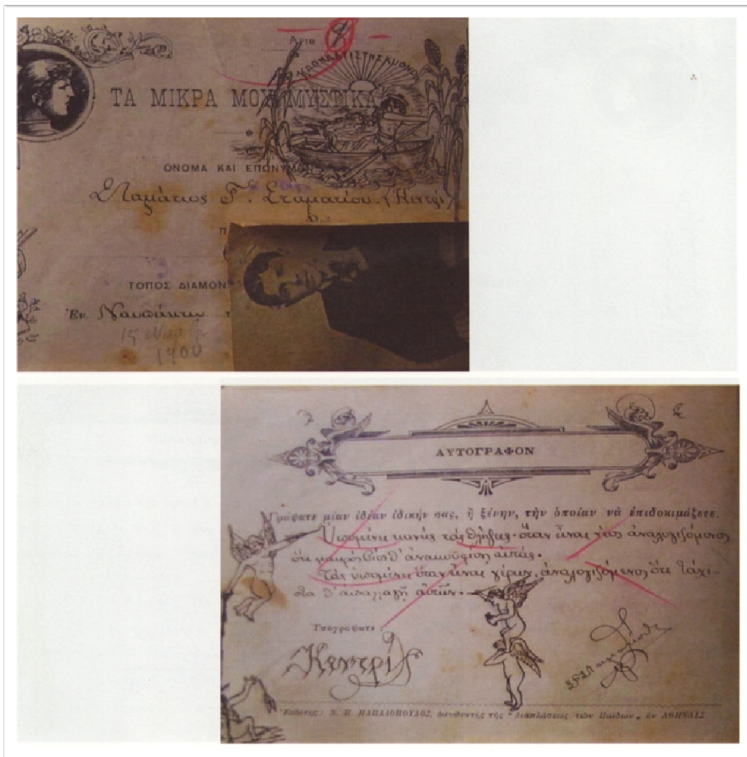
Εικόνα 3: Το τετράδιο του συνδρομητή των "Μικρών Μυστικών" Σταματίου Σταματίου που υπογράφει ως "Κεντρί"

*Το φωτογραφικό υλικό που παρουσιάσαμε, παρατίθεται στο: Χουρδάκης, Α. (2004), Από τη μικροϊστορία της παιδείας. Ένα παιδικό λεύκωμα του 1900-1904. Αθήνα: Ατραπός, σ. 519, 529 και 579