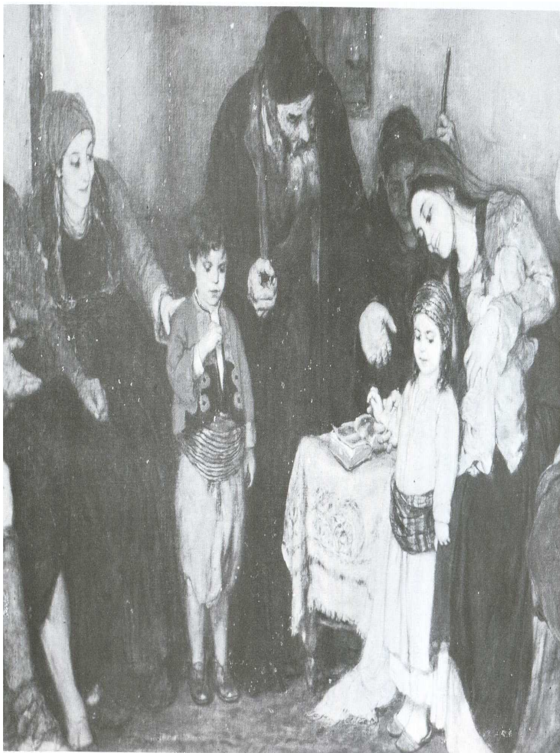
Εικόνα 3: Νικόλαος Γύζης, Τα αραβωνιάσματα των παιδιών (1877), λάδι σε μούσαμα, 1,03 x 1,55 μ. Εθνική Πινακοθήκη (λεπτομέρεια).