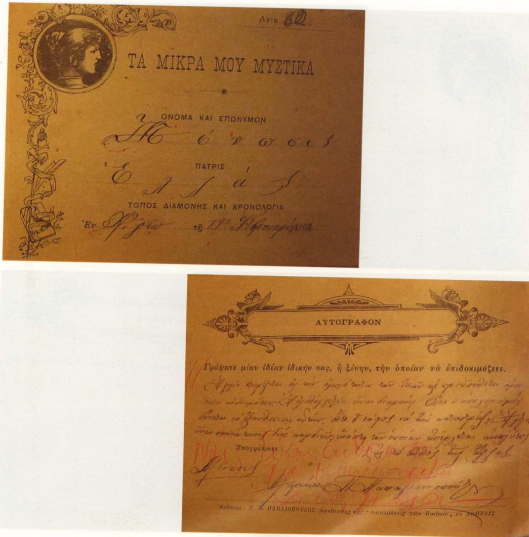
Εικόνα 2: Το τετράδιο των "Μικρών Μυστικών" της συνδρομήτριας Μαρίκας Π. Παπαγιαννοπούλου που υπογράφει ως "Μόνωσις"