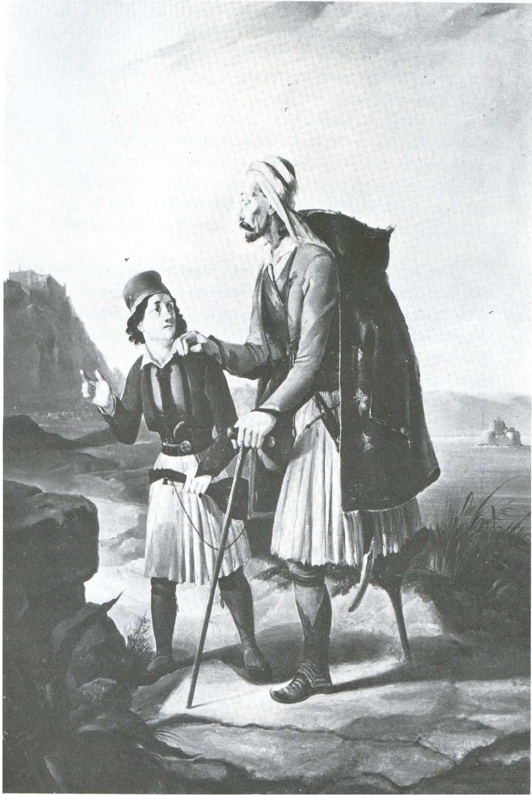
Εικόνα 1: Θεόδωρος Βρυζάκης, Ανάπιχος του Αγώνα (1840), λάδι σε μουσαμά, 0, 62 x 0,48 μ. (Μουσείο Μπενάκη)