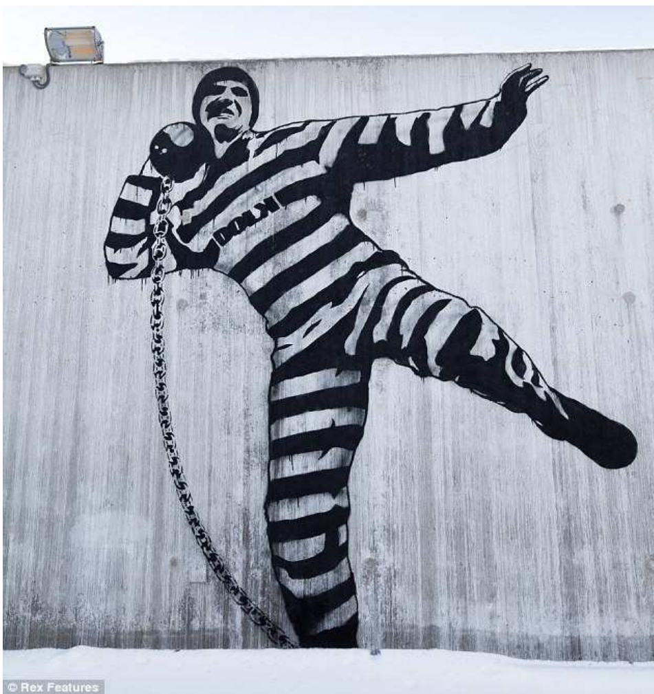
Εντοπωσιακό γκράφιτι από τον street artist Dolk στην αυλή της φυλακής Halden

έχουν δημιουργήσει καλλιτέχνες. Τα παράθυρα είναι μεγάλα και τα κάγκελα απουσιάζουν. Σίγουρα, ένα ευχάριστο περιβάλλον, όπως αυτό της φυλακής Halden, διευκολύνει την κίνηση των κρατουμένων στον χώρο και μειώνει τα “δεινά του εγκλεισμού”. Κάποιοι θεωρούν ότι οι φυλακές νέας γενιάς, όπως η Halden, αποτελούν ανθρώπινη εναλλακτική λύση. Από την άλλη, κάποιοι πιστεύουν πως εσφαλμένα δίνονται ανέσεις σε έναν πληθυσμό με εγκληματική συμπεριφορά (Hancock & Jewkes, 2011).