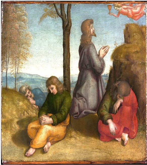
The Agony in the Garden of Gethsemane, 1504, Metropolitan Museum of Art

ατμοσφαιρική διάθεση. Δεν ισχυριζόμαστε ότι η ποίηση του Παπατσώνη υστερεί σε κάτι, ούτε ότι η δυτική τέχνη υστερεί έναντι της βυζαντινής, απλώς είναι διαφορετική η προσέγγιση και αυτή την προσέγγιση προσπαθούμε να κατανοήσουμε.