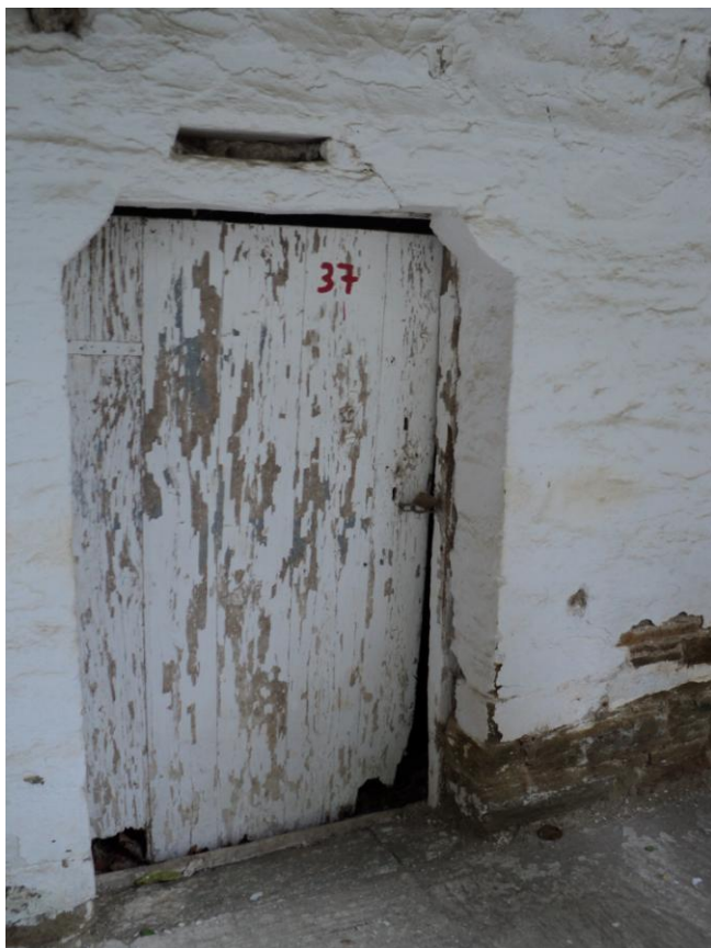
Το κελί 37. Ο «μπαλαούρος»