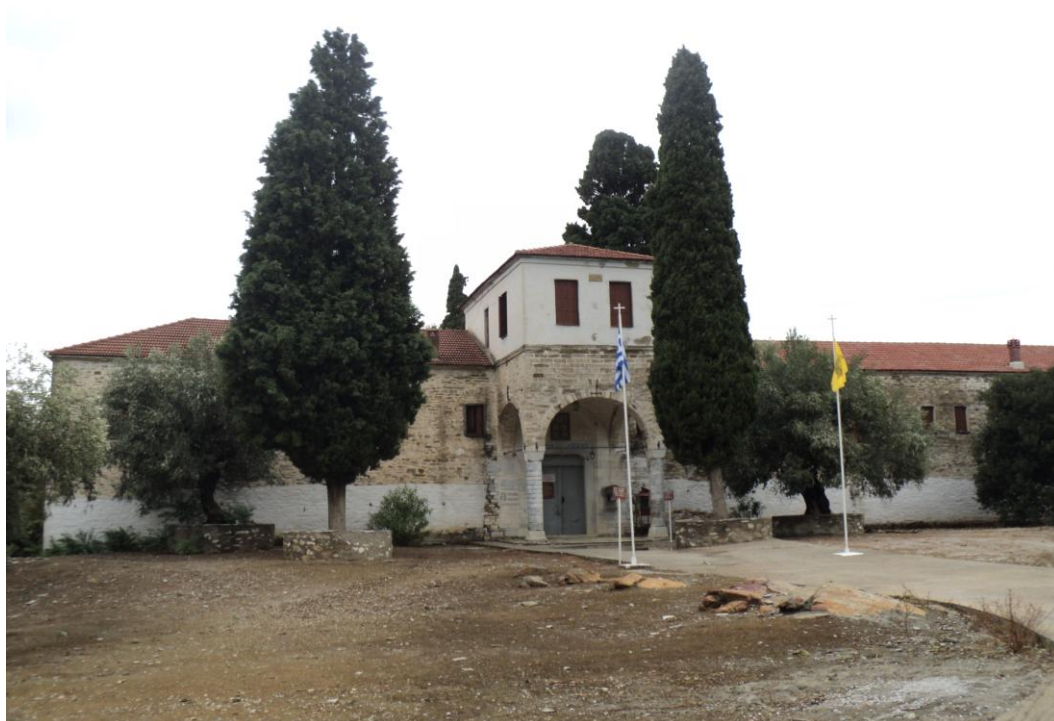
Το μοναστήρι σήμερα