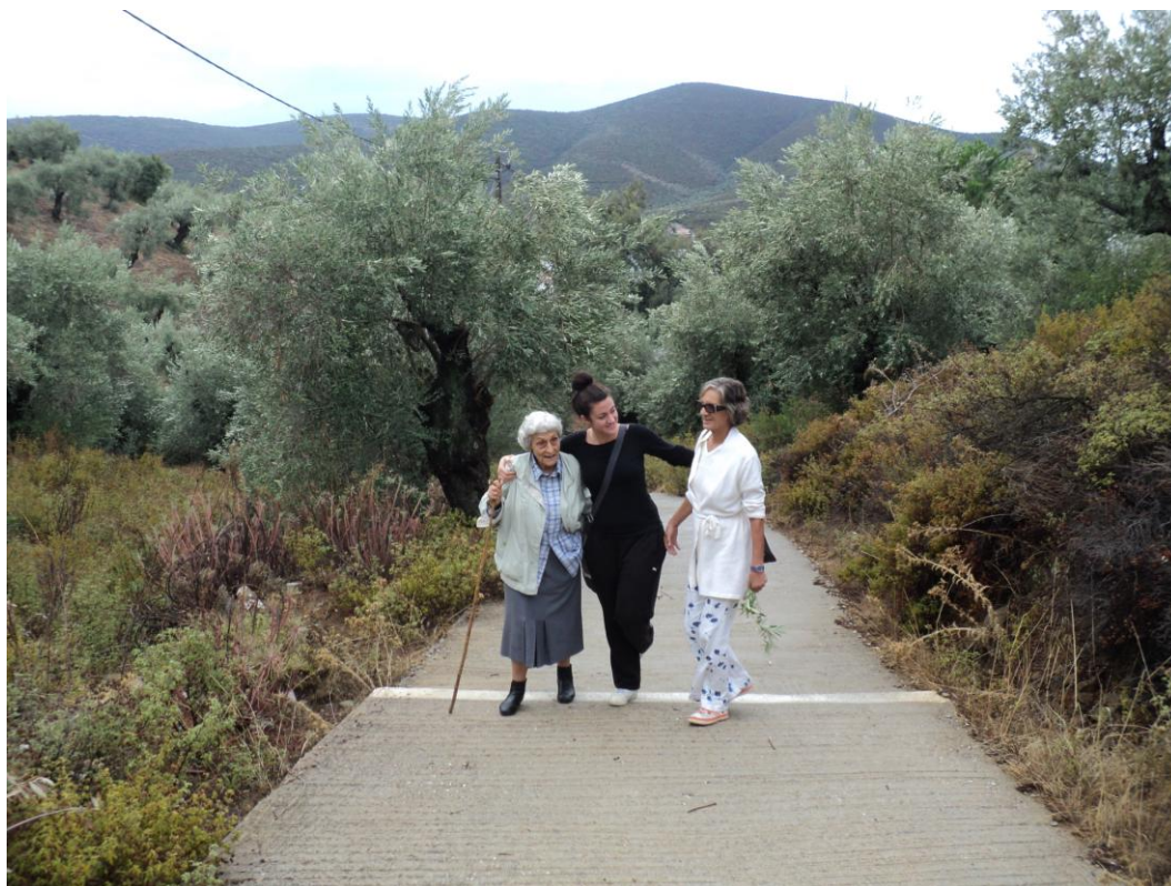
Η διαδρομή προς το μοναστήρι