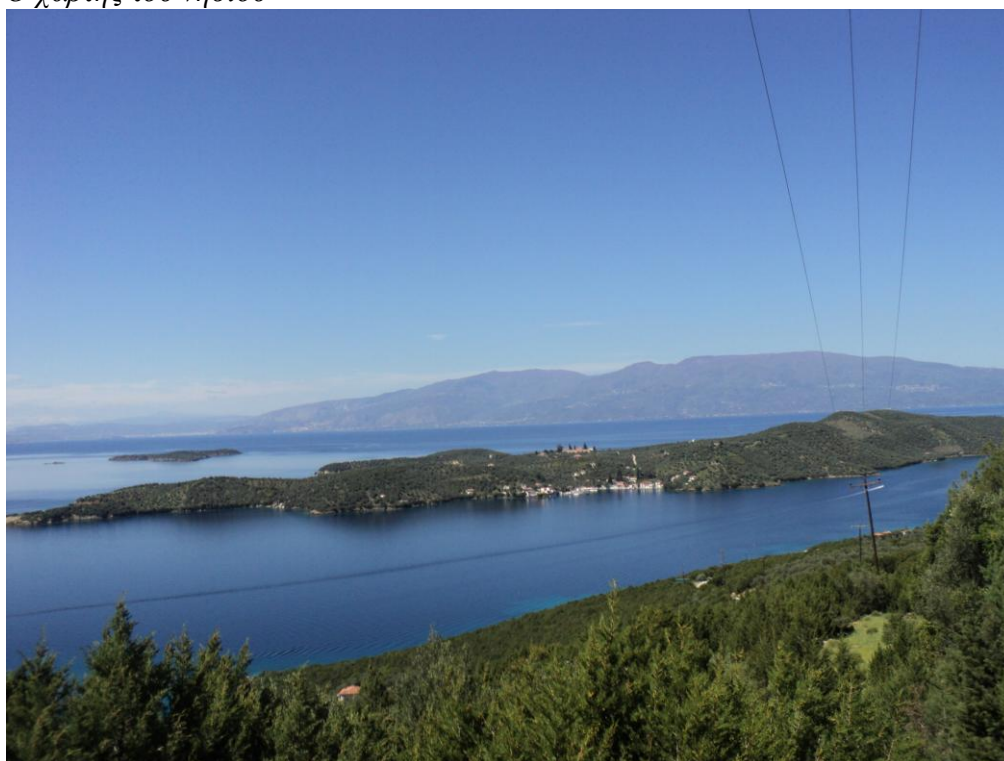
Το νησί πανοραμικά