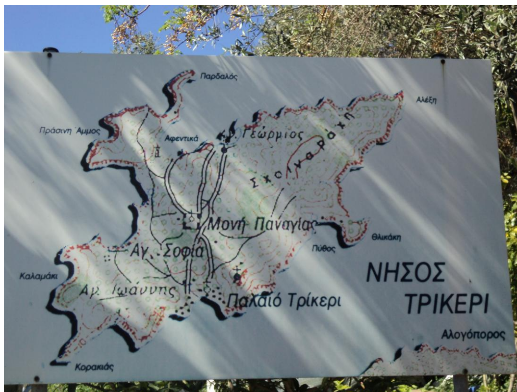
Ο χάρτης του νησιού