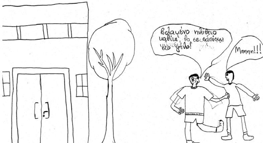
Andreou E., Bonoti F., 2010)