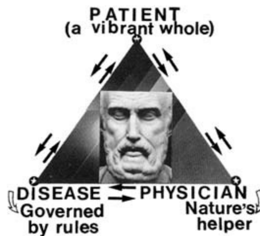
Three interacting elements of Hippocratic rational system

νόσημα και, συνεπώς, πρέπει να θεραπευθεί. Τέλος, ο ιατρός, ο οποίος χαρακτηρίζεται ως ύπηρετης τῆς τέχνης , έχει καθήκον να αντιμετωπίσει το νόσημα, ώστε να προσφέρει στον νοσούντα την ίαση και, συνεπώς, τη σωτηρία. Μαζί με τον ασθενή, ο ιατρός θα συνεργαστεί, για να καταπολεμηθεί το νόσημα, κι έτσι θα προσφέρει τις υπηρεσίες του τόσο προς την τέχνη όσο και προς τον άνθρωπο που θεράπευσε.