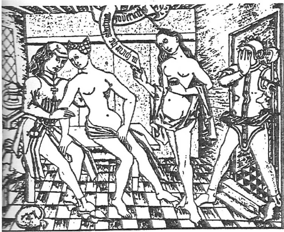
14. Χαρακτικό του Master of the Banderoles, 1464

digitalcommons.unl.edu/cgi/viewcontent.cgi