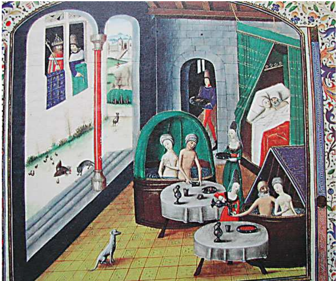
16. Σκηνή από λουτρά από το έργο του Βαλέριου Μάξιμου (Velerius Maximus), Des faits des Romains , 15 ος αιώνας. Εθνική Βιβλιοθήκη του Arsenal, κωδ. 5196 f. 372

http://fatosoda.seesaa.net/article/140354394.html