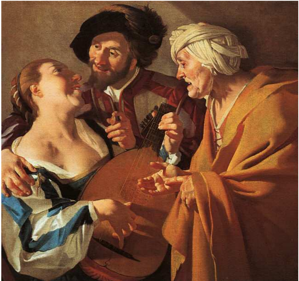
17. Dirck van Baburen, Η πόρνη , 1622