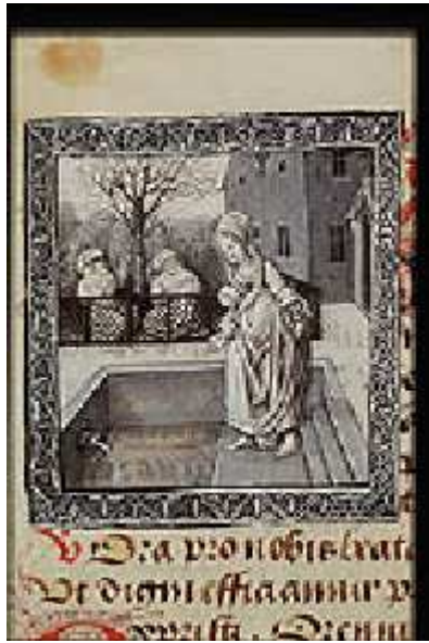
10. Gilsberg de Groot Kenr, 1793, Historie van den ouden en den jongen. "Tobias" , Αμστερνταμ http://www.kb.nl/manuscripts/education